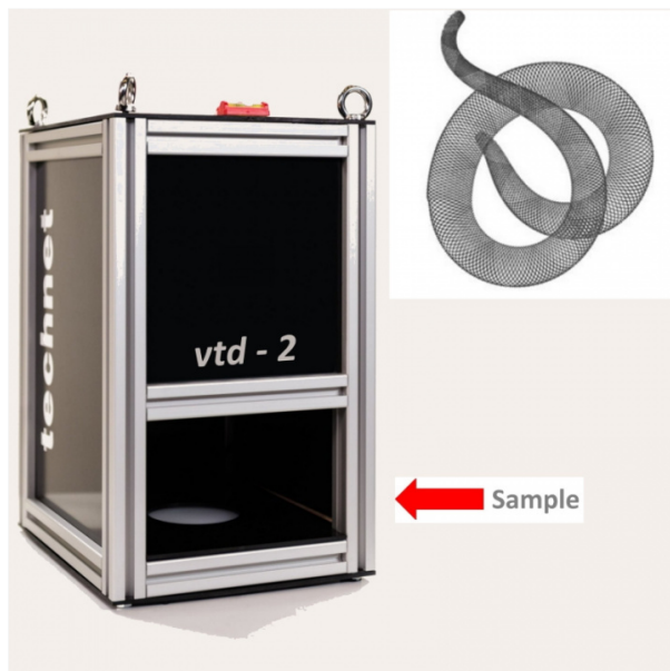
Génération de motifs de lumière transmise à l'aide de la caméra et calcul de la vitalité des larves

Le Viability Test Device (VTD, dispositif de test de viabilité) de la société technet GmbH est un système de mesure adapté à ces incertitudes. Il exécute un contrôle optique automatisé et indépendant. La base du système repose sur une caméra USB 3.0 de la société IDS Imaging Development Systems GmbH. Elle est positionnée à la verticale sur une boîte de Petri. Au sein d'une plage de longueurs d'ondes étroite dans le spectre de l'infrarouge proche (NIR), des séries d'images des échantillons sont produites dans la lumière transmise et sont complétées par des mesures de température infrarouge. Sur chaque image, les données relatives à la caméra, la température, l'éclairage, la position et le temps sont inscrites. Le protocole d'étude comprend alors des données brutes complètes, ce qui permet de tracer les résultats des tests.